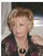
WICEPRZEWODNICZĄCY Jolanta Firlej-Dobrzańska