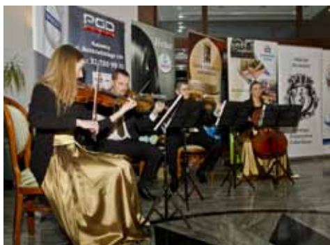
Muzyka w najlepszym wykonaniu. Kwartet smyczkowy na powitanie, a zespół This Cover Band do tańca.

Renault Wektor, Volvo Auto Boss, Japan Motors, Perfumerie Douglas, Lewiatan Makowscy, TiM S.A., BMW Sikora, Butik COCO SHOP, Deichman, Salon Urody EstetikLaser, Siłownia BKS Stal, Klub Sportowy LIVE, Marrodent Sp. z O.O., Polmedico - Poliklinika Stomatologiczna Pod Szyn- dzielnią, Mitas Design, Park Hotel Papuga, GAMEBO – DOM, Uzdrowisko Ustroń.