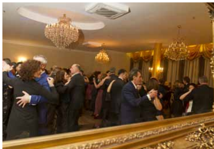
Piękne sale Parkhotelu Vienna idealnie pasowały do balu w stylu wiedeńskim.

Po kilkuletniej przerwie Bal Lekarza organizowany przez Beskidzki Oddział Polskiego Towarzystwa Lekarskiego i Beskidzką Izbę Lekarską znów powrócił do Bielska Białej. W sobotę 30 stycznia w eleganckich salach bielskiego Parkhotelu Vienna na balu w stylu wiedeńskim bawiło się blisko 200 osób.