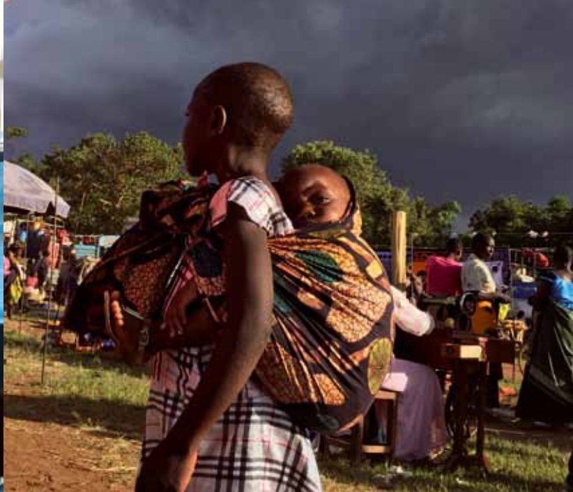
Codziennosc w afrykańskiej wiosce.

mogliśmy im pomóc. Tak samo jak ogromnej puli dzieci z przepuklinami, których też nie byliśmy w stanie zoperować, bo dzieci do zabiegu trzeba uspić – tłumaczy doktor Kozieł.