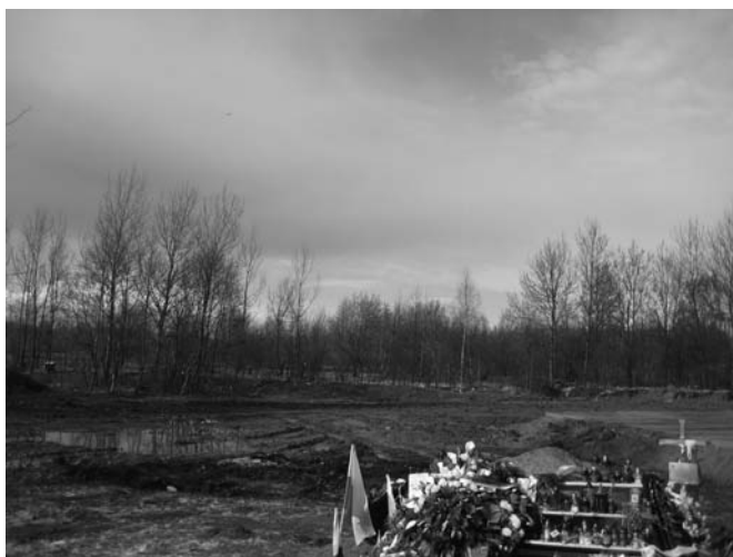
Miejsce katastrofy w Smoleńsku. Na pierwszym planie gład upamiętniający zdarzenie, kwiaty, znicze i flagi złożone przez przedstawicieli władz Rosji i Polski oraz uczestników wyjazdu.