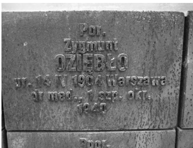
Jedna spośród wielu symbolicznych tablic nagrobnych lekarzy na Polskim Cmentarzu Wojennym w Katyniu