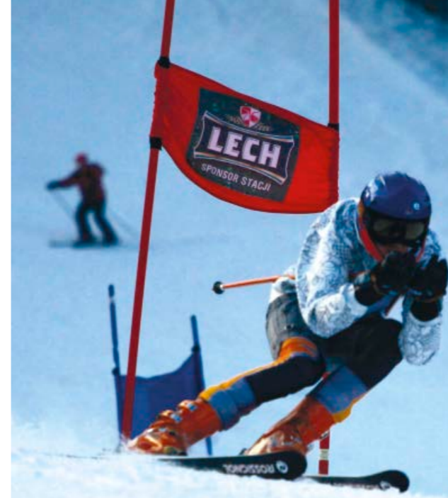
Walka z czasem na trasie giganta na Stożku

zgromadziło się 37 zawodniczek i zawodników. Oglądanie, rozgrzewka, a o 11:30 rozpoczął się pierwszy przejazd. Nieustanne padający śnieg ograniczał widoczność ale obyło się bez wyroków.