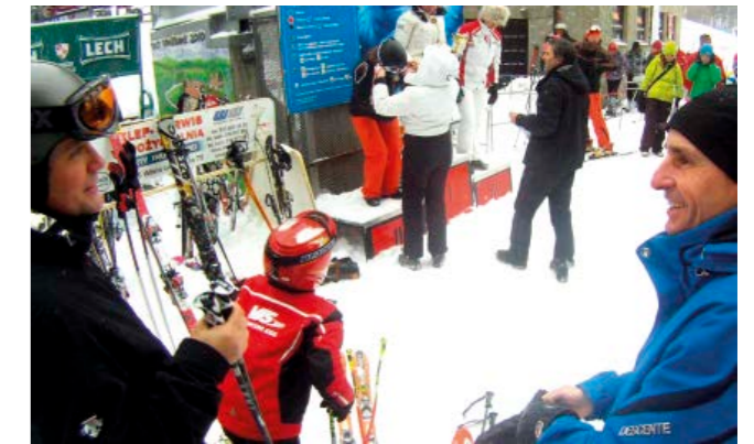
Dekoracja zwycięzców jubileuszowych X Mistrzostw Śląska Lekarzy na Stożku