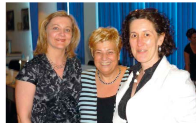
Przedstawiciele naszej izby na posiedzeniu komisji stomatologicznej